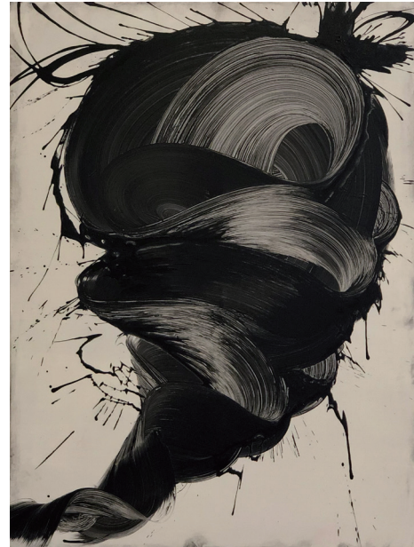
Untitled #4 Acrylic on cotton canvas, 120×90cm, 2022