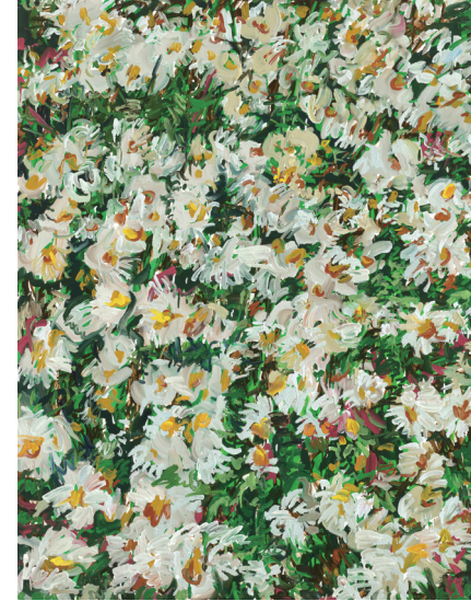
Little Flowers I Oil on canvas, 145×112cm, 2021