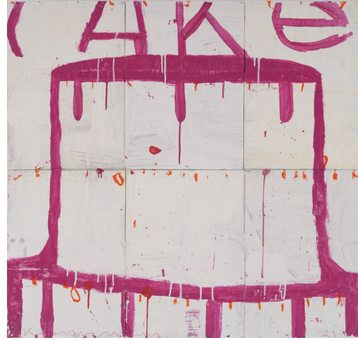
Cake stacked, Deep Pink on White Crème Water based enamel paint on paper sacks, 86.4×91.2 cm, 2021