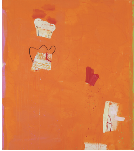
Don't tell Lizzie Borden Mixed media on canvas, 183×152.5 cm, 2019