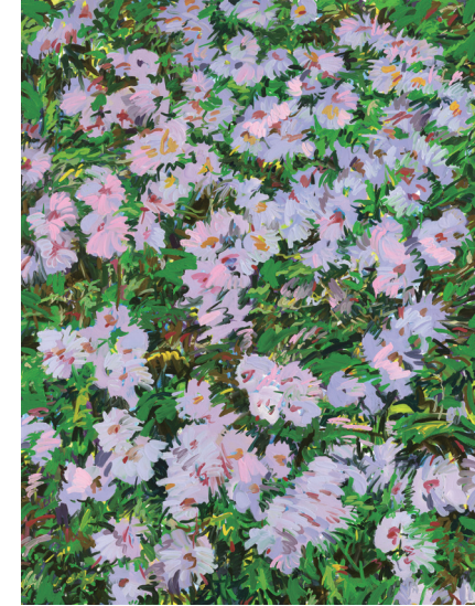
Little Flowers II Oil on canvas, 145×112cm, 2021