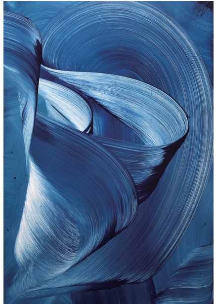
New Skin Acrylic on aluminium composite panel, 180×120cm, 2022