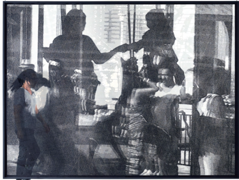
MAYA6199 2016, stainless steel mesh, 217×287×13cm