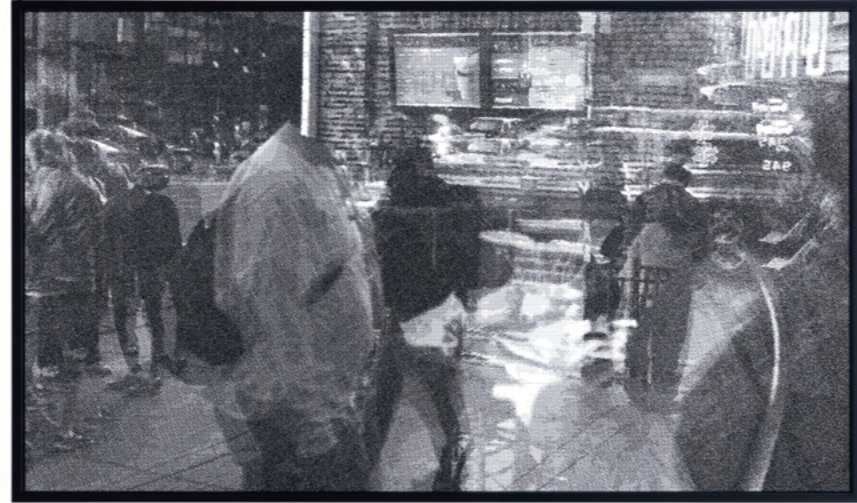
MAYA9111 2018, stainless steel mesh, 155×263×7cm