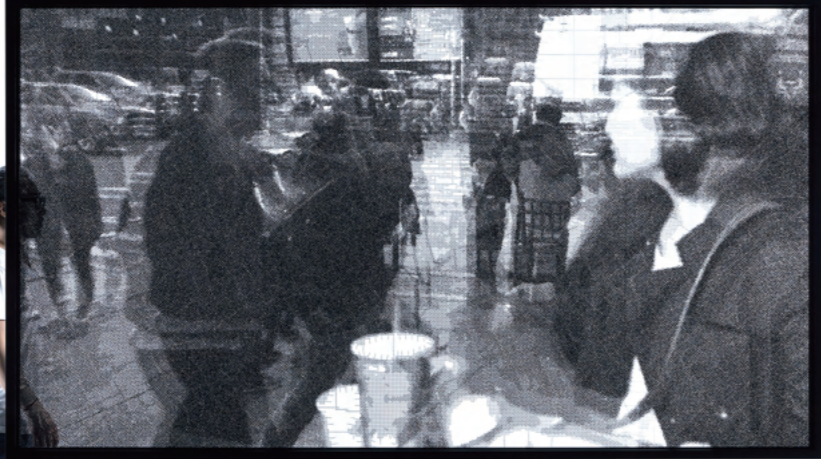
MAYA9110 2018, stainless steel mesh, 145×257×9cm