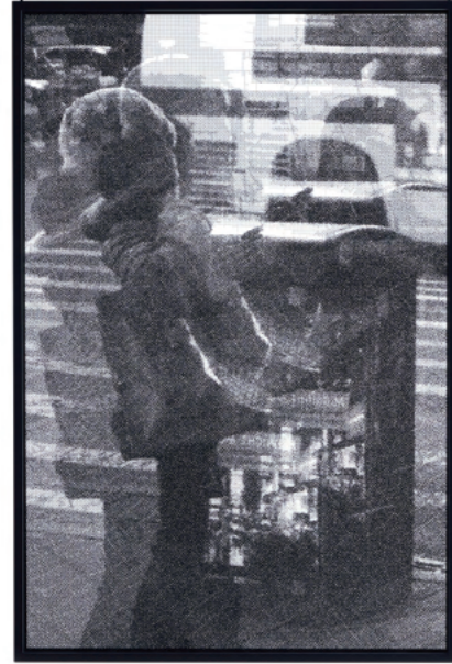
MAYA9108 2018, stainless steel mesh, 182×122×9cm