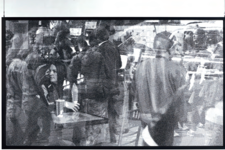
MAYA9105 2018, stainless steel mesh, 160×270×8cm