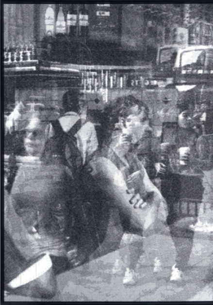
MAYA9077 2017, stainless steel mesh, 160×226×8cm