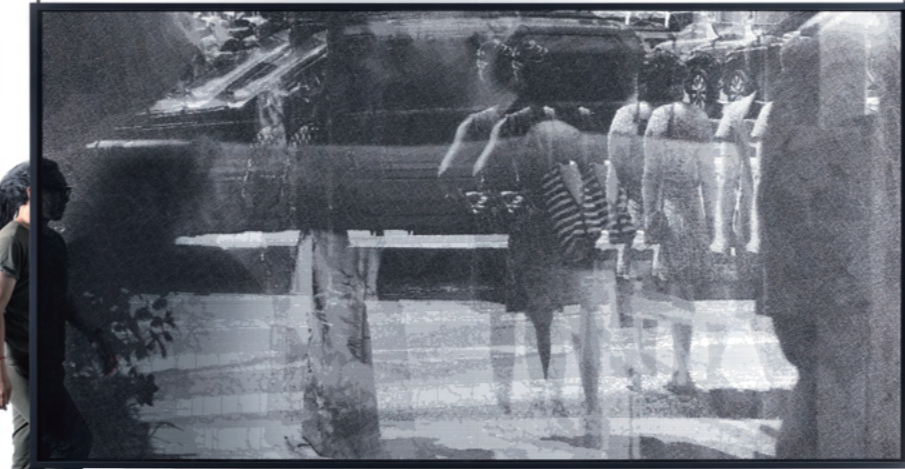
MAYA2409 2017, stainless steel mesh, 180×340×9.2cm